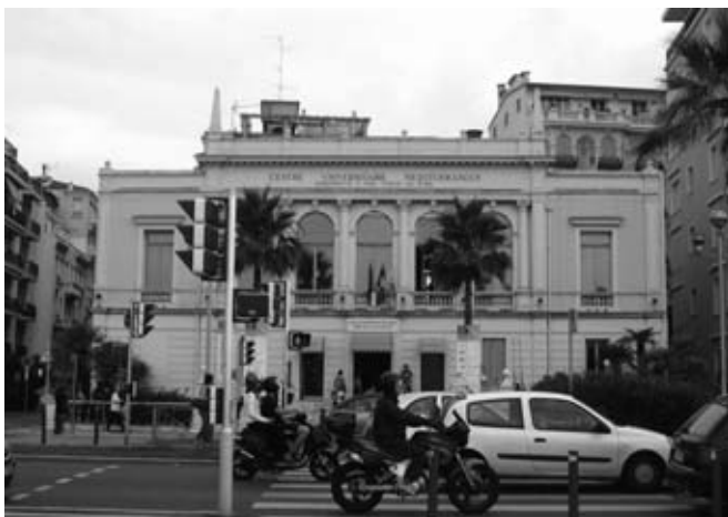
Viduržemio jūros universitetinis centras.

Stigma – nemaloniausias psichikos ligos padarinys, tai pripažįstama kaip dar viena liga . Stigma – tai neigiamas požiūris į psichikos ligos diagnozę turintį asmenį, tai kančia, susijusi su aplinkinių reakcija. Labai dažnai psichikos sutrikimo diagnozė sugadina žmogaus gyvenimą labiau negu pats psichikos sutrikimas. Sergantysis kenčia ne tik nuo būdingų jo ligai simptomų, bet ir nuo stigmos, kuri gali pabloginti klinikinę ligos eigą, padidinti jo socialinę atskirtį, kenkti visoms gyvenimo sritims: šeimai, profesijai, visuomeninei veiklai.