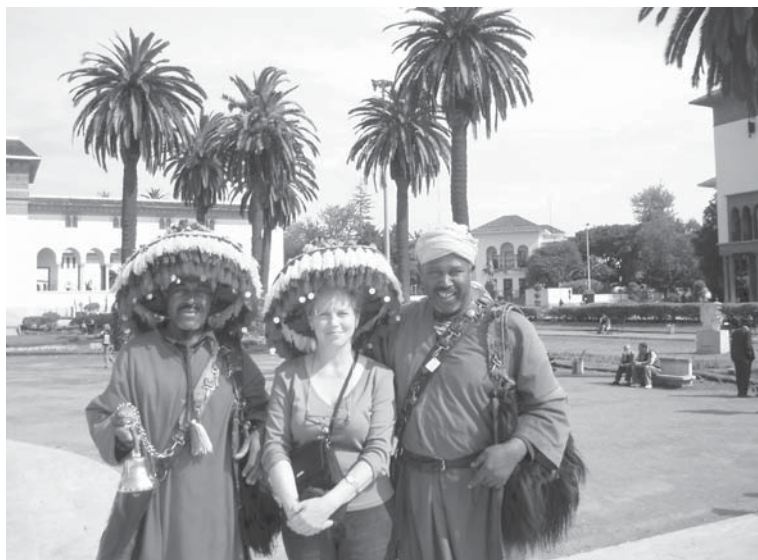
Dijana su vandens pardavėjais.

Toliau vykstame į Rabatą , Maroko karalystės sostinę. Miestas gyvena 1 mln gyventojų, jis padalytas į dvi dalis: vienoje – Rabatas, kitoje – Sali. Aplankėme Maroko Karaliaus Mahometo VI-tojo rezidenciją, Mahometo V-tojo mauzoliejų, Hasano minaretą (Le Tour Hasan), Kazbą (įtvirtintoji Rabato senamiesčio dalis).