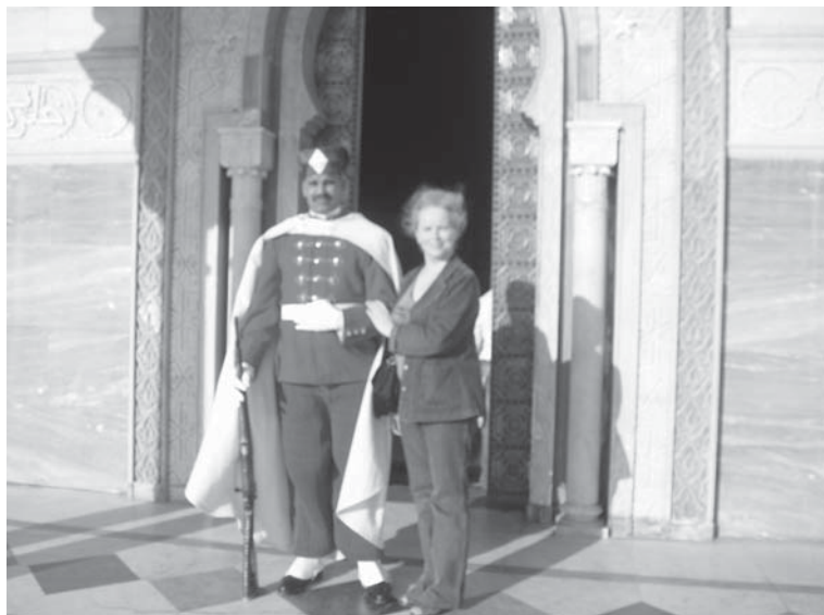
Dijana su karališkosios armijos gvardiečiu Rabate.

Kitos dienos rytą išvykome į Volubilį , vieną iš geriausiai išsilaikiusių romėnų miestų Maroke. 40 ha plote puikiai matyti buvusi gatvių struktūra, romėniškų vilų fragmentai su mozaikomis (mums parodė mozaiką su medžioklės deivės Dianos atvaizdu), forumo aikštė,