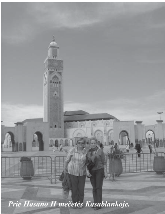
Prie Hasano II mečetės Kasablankoje.

Kitą rytą, po pusryčių, išvykome į Kasablanką , Maroko ekonomikos ir verslo sostinę (350 km nuo Esauiros), kuriame gyvena 4 mln gyventojų. Nepaprastai gražus miestas, turtingi namai, švara, įvairiaspalvė augmenija. Aplankėme Hasano Antrojo mečetę, trečią pagal dydį islamo pasaulyje. Mečetės viduje telpa 25 000 maldininkų, dar 60 000 susirenka prie mečetės. Mečetė buvo statoma 5-erius metus. Atidaryta 1993 m. Kadangi